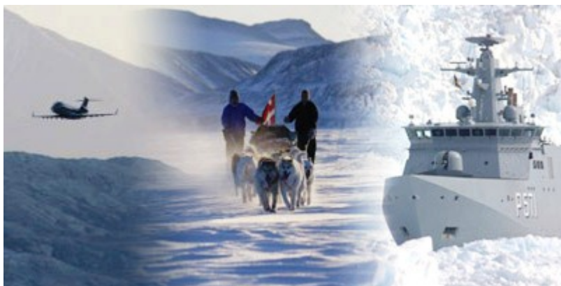
Den herlige collage er kreeret i Forsvarets Mediecenter

Den 31. oktober blev den værnssfælles Arktisk Kommando oprettet med hovedsæde i Nuuk, og med et mindre forbindelselement på Færøerne. Arktisk Kommando har et vidtstrakt ansvarsområde med hovedopgaver at håndhæve det militære forsvaret af Grønland og Færøerne, overvågnings- og suverænitethåndhævelse, fiskeriinspektion, eftersøgnings- og redningstjeneste, miljøovervågning, forureningsbekæmpelse samt en række støtteopgaver for det civile samfund.